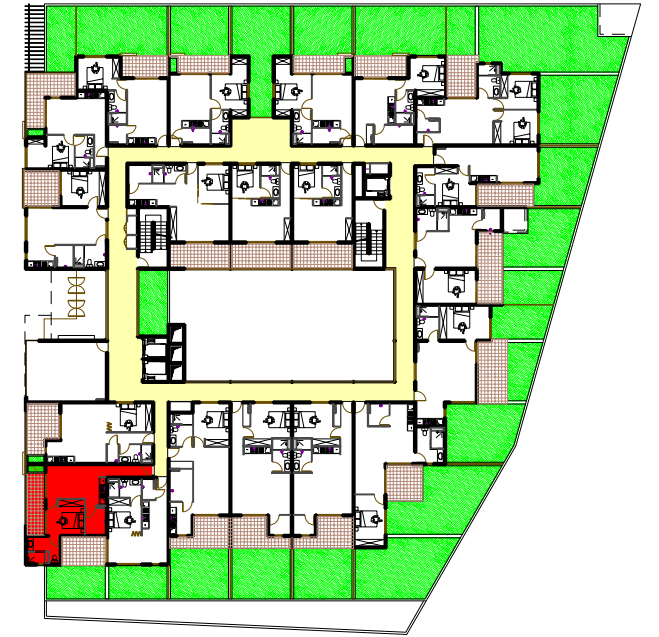
Plan du R+1 sans échelle